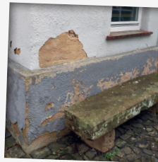
Wände sind feucht