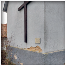
Putz blättert überall ab

Dafür bittet die Petrus-Gemeinde um Ihre Unterstützung!